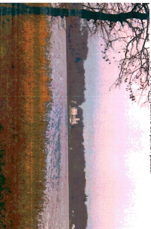
Park i pałac od strony jeziora – widok z przeciwnego brzegu.