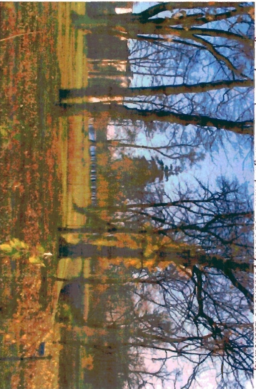
Fragment parku w części południowo-zachodniej.