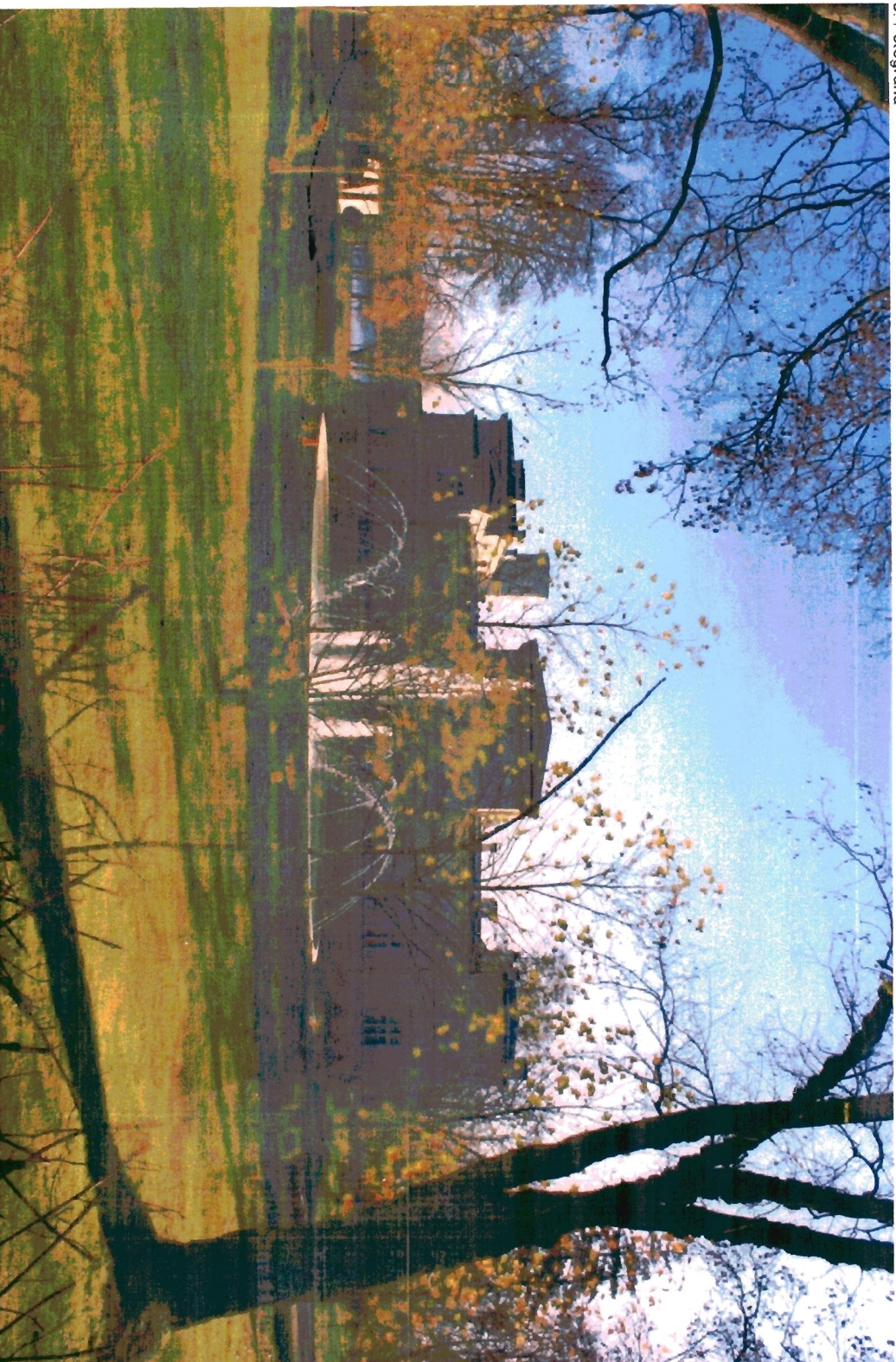
Fasada pałacu od strony parku (zachodniej)