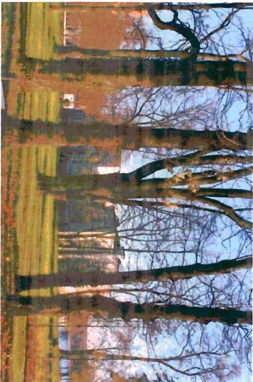
Fragment parku i pałac na drugim planie – od strony południowo-zachodniej