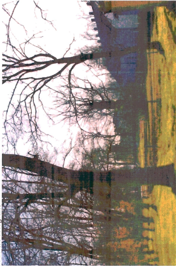
Fragment parku w części zachodniej – między folwarkiem a stajniami.