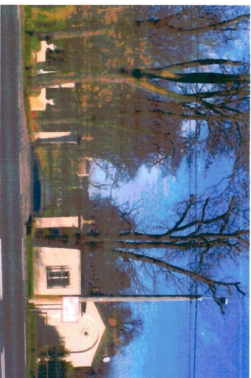
Brama i aleja wiązowa do parku i pałacu.